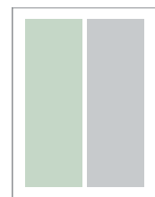
1/2-side stående 90 x 260 mm